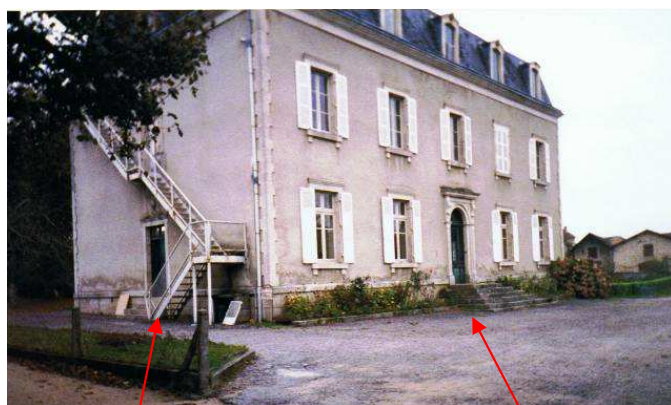
Façade avec escalier de secours (sud-est)