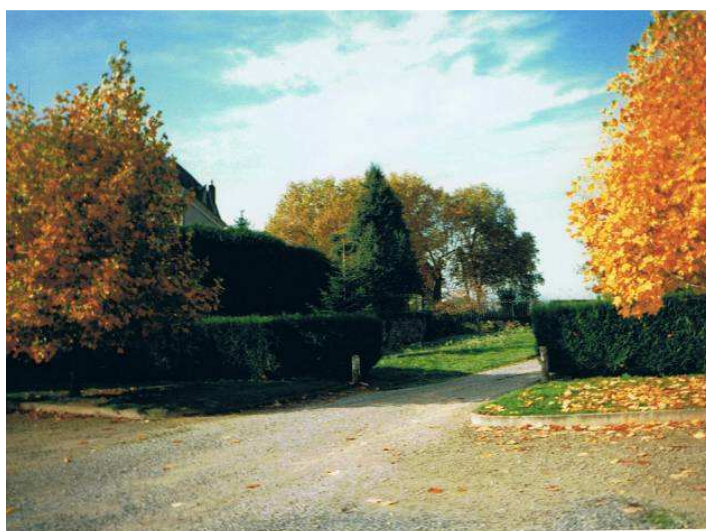
Entrée dans la propriété depuis la place communale