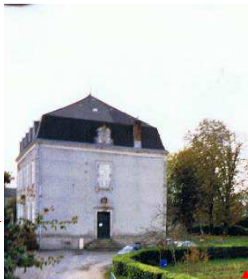
Façade côté (nord-ouest) Jardin