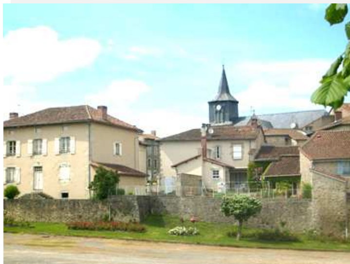
Un aperçu du bourg

A 375 km de Paris, près de l'autoroute A20 et de l'axe « Centre Europe Océan », Cieux se situe à 30 km au nord ouest de Limoges, à 16 km de Bellac et de Saint-Junien.