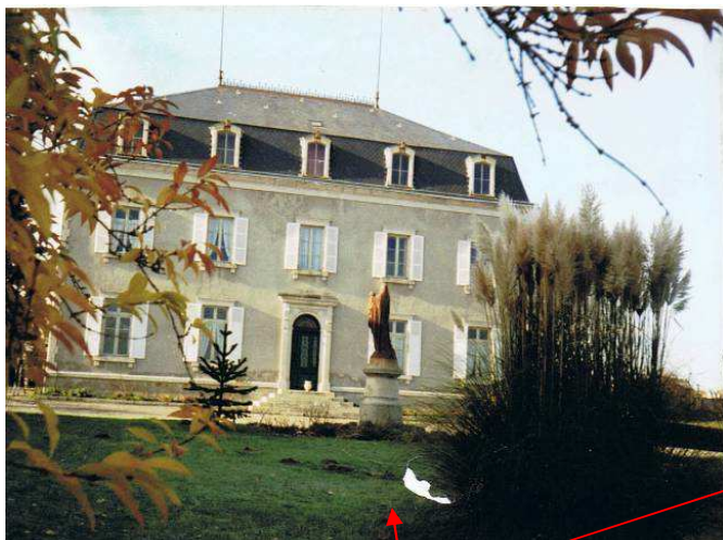
Façade principale (nord-est)

Superficie du bâtiment : 280 m 2 . Il est chauffé au fuel.