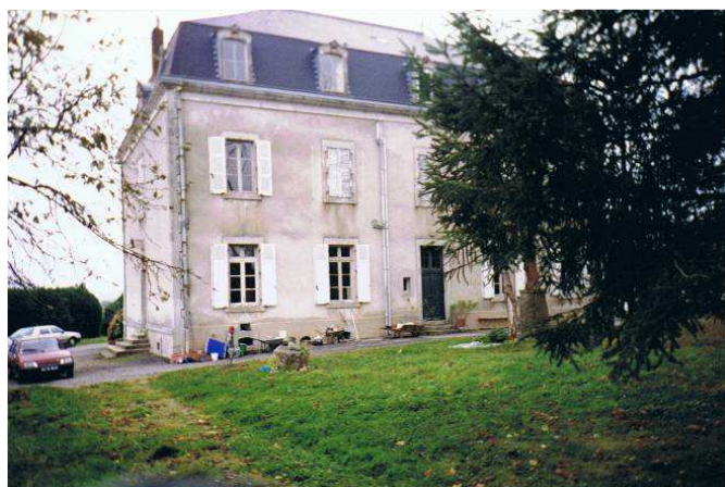
Façade arrière (sud-ouest)